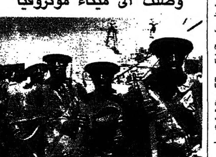
قوة الفصل الافريقية في مرفأ فريكين في سيراليون قبل توجهها الى مونروفيا (رويترز)